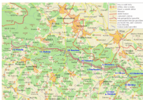
Přehledná mapa opevnění v Lužických horách

Při výletech do Lužických hor nacházíme poměrně často opuštěné betonové pevnůstky, které tvoří téměř souvislou linii pohraničního opevnění, vybudovanou v letech 1937-1938. Tyto pevnůstky nikdy nemohly splnit úkol, pro který byly postaveny, ale dodnes jako němi svědkové připomínají poměrně krátkou a velmi pohnutou kapitolu z historie naší vlasti. S bližšími podrobnostmi o vzniku, výstavbě a osudech tohoto důmyslného obranného systému se můžete seznámit v tomto článku.